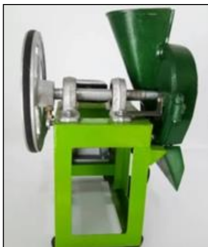
a. Bentuk corong

Berdasarkan hasil kuesioner B, diketahui kebutuhan mesin yang diinginkan UMKM adalah mesin yang dapat mengiris benguk secara lebar dan tidak hancur, berbahan stainless (tidak mudah berkarat), memiliki desain yang tertutup dan aman saat digunakan, dan mudah dibongkar pasang untuk diperbaiki maupun dibersihkan. Rekomendasi mesin pengiris kacang koro benguk dapat dilihat pada gambar 4.