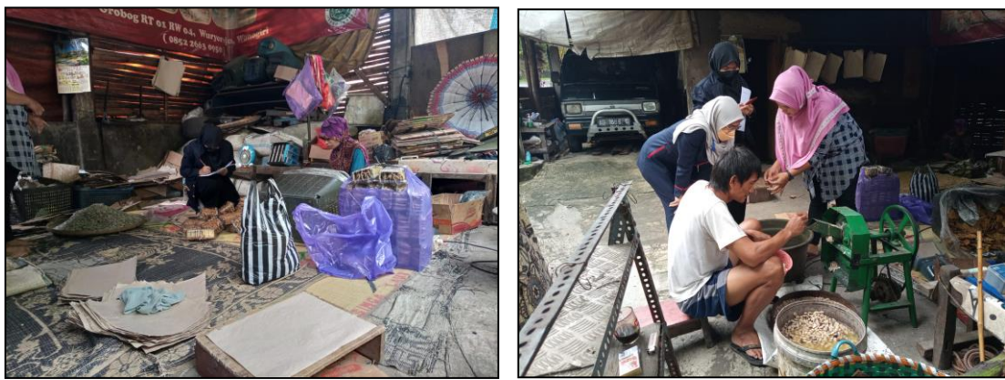
Gambar 2. Wawancara dan pengisian kuesioner

Pada sentra keripik bengkuk Grobog Wonogiri terdiri dari kurang lebih 9 UMKM. Sentra tersebut dikoordinasi oleh ketua RW setempat untuk pengembangan dan pendistribusian produk jadi. Usaha Mikro Kecil dan Menengah (UMKM) pada sentra keripik bengkuk Grobog Wonogiri memproduksi sebanyak kurang lebih 30 kg bengkuk setiap produksi. Produksi tersebut berawal dari pencucian bengkuk, perebusan bengkuk, perendaman bengkuk, pemotongan bengkuk, peragian, proses penjamuran, penggorengan, pengemasan, dan distribusi. Pada proses pengirisan dibantu dengan mesin pengiris. Namun, hanya 70 persen yang diiris dengan mesin, sisanya masih diiris dengan cara manual. Hal tersebut karena mesin belum mampu mengiris seperti kebutuhan. Beberapa hasil irisan dengan mesin mengalami pecah dan berbentuk serpihan. Mesin pengiris kacang koro bengkuk yang saat ini digunakan dapat dilihat pada Gambar 2.