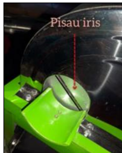
b. Bentuk Mata Pisau