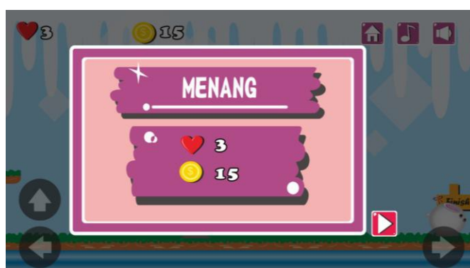
Gambar 4. Pembuatan Storyboard Popup Menang