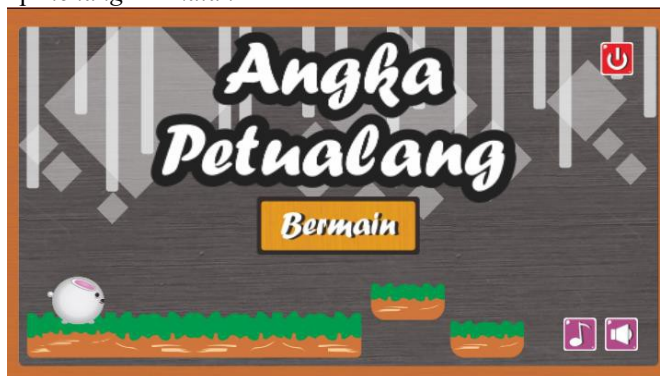
Gambar 1. Pembuatan Storyboard Menu Utama

multimedia ke dalam sistem permainan yang terdiri atas menu utama, menu level, serta tampilan hasil permainan seperti popup menang dan kalah .