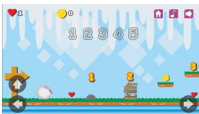
Gambar 3. Pembuatan Storyboard Game