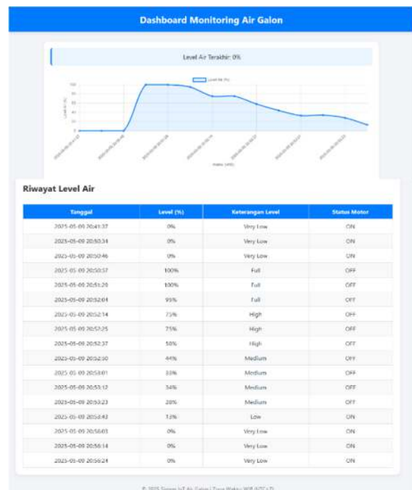
Gambar 2. Dashboard web