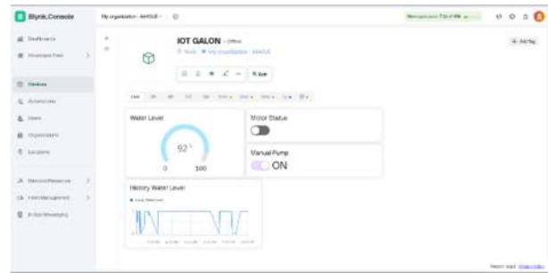
Gambar 1. Antarmuka Blynk IoT

Antarmuka aplikasi Blynk menampilkan informasi level air galon secara real-time. Tiga elemen utama yang ditampilkan dalam aplikasi adalah: