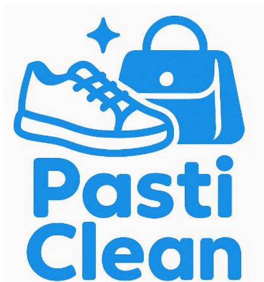
Gambar 2. Desain Logo PastiClean

Berdasarkan hasil wawancara dengan pemilik usaha maka diperoleh informasi mengenai usaha jasa cuci sepatu dengan nama brandnya ialah PastiClean. Dari hasil perancangan desain logo dihasilkan desain logo seperti gambar 2 berikut ini.