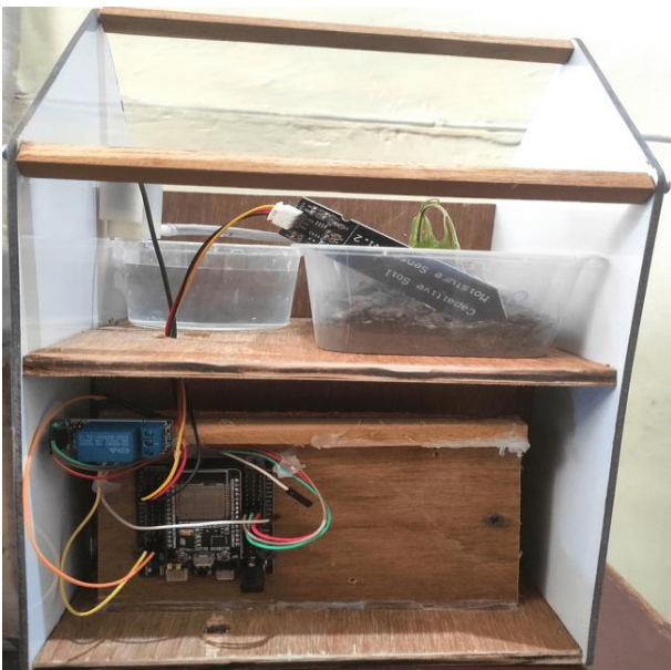
Gambar 4. Gambar alat sudah jadi

Alat penyiram otomatis tanaman cabai berbasis IoT diatas merupakan prototipe sistem irigasi cerdas yang bekerja dengan membaca tingkat kelembapan tanah secara otomatis dan mengatur penyiraman melalui pompa air mini. Sistem ini menggunakan sensor kelembapan tanah (soil moisture sensor) yang ditancapkan ke dalam media tanam untuk mendeteksi kadar air. Data dari sensor dikirim ke mikrokontroler ESP32 yang berfungsi sebagai otak sistem, memproses sinyal dari sensor dan menentukan apakah pompa perlu dinyalakan atau tidak. Jika kadar kelembapan di bawah 35%, ESP32 akan memerintahkan relay untuk mengaktifkan pompa air yang akan mengalirkan air dari