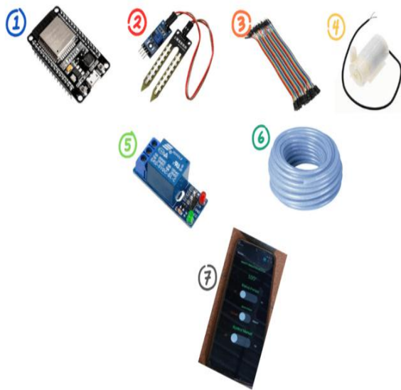
Gambar 3. Gambar alat yang digunakan

1. Komponen pertama adalah ESP32 , yaitu mikrokontroler yang berfungsi sebagai pusat kendali sistem. ESP32 memiliki konektivitas WiFi yang memungkinkan sistem berkomunikasi dengan aplikasi Blynk. Perannya sangat penting dalam memproses data dari sensor kelembapan tanah dan mengaktifkan atau menonaktifkan pompa air secara otomatis. Selain itu, ESP32 juga mengirimkan data kelembapan ke Blynk untuk keperluan monitoring dan kontrol manual.