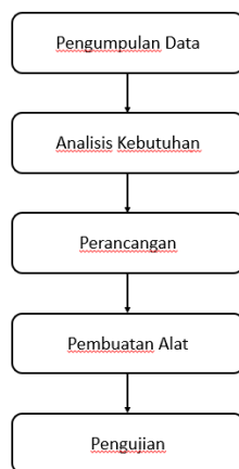
Gambar 1. 1 Metode Penelitian

Metode penelitian adalah suatu tahapan penelitian yang harus ditetapkan sebelum melakukan pemecahan masalah. Dengan metode penelitian diharapkan dapat membantu penelitian menjadi lebih jelas dan terarah. Berikut ini merupakan tahapan metode penelitian yang dilakukan :