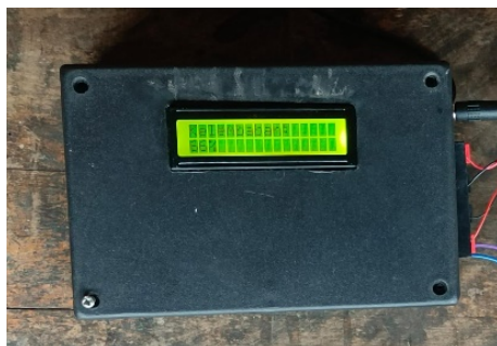
Gambar 1. 3 Foto Alat

Perancangan software tampilan dilakukan menggunakan platform Blynk untuk menampilkan nilai kelembaban tanah.