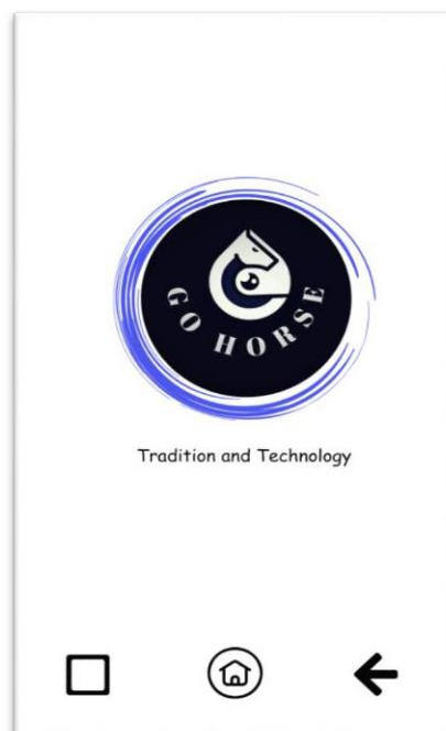
Gambar 1. Tampilan Awal Go Horse

Berikut merupakan rancangan tampilan Go Horse. Pada Gambar 1 menunjukkan tampilan awal Go Horse. Pengguna dapat mengakses aplikasi dengan tampilan pertama terdapat logo dan slogan dari Go Horse. Tampilan yang simpel dan tidak penuh warna agar terkesan elegan.