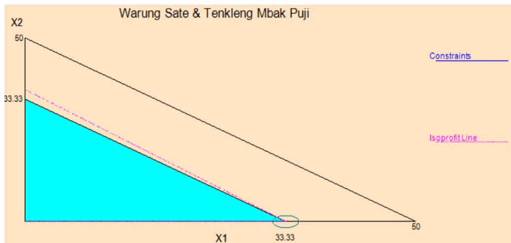
Gambar 2. Penyelesaian Menggunakan Metode Grafik

Daerah layak adalah segitiga di bawah garis x_1 + x_2 = 33 .