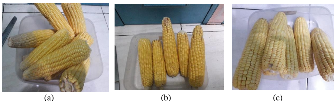
Gambar 1. Tiga Varietas Jagung Manis (a). Talenta (b). Super sweet dan (c). Bonanza

Bahan-bahan yang digunakan dalam penelitian ini adalah jagung manis varietas super sweet, talenta, dan bonanza yang didapatkan dari petani Boyolali Jawa Tengah (Gambar 1), gula merk Gulaku, starter instant non dairy yoghurt starter merk Belle+Bella yang mengandung kultur Lactobacillus bulgaricus , Lactobacillus acidophilus dan Streptococcus thermophilus , NaOH 0,1N, Phenolptelin 1%, Aquadest. Alat-alat yang digunakan dalam penelitian ini adalah pengaduk, baskom, botol kaca, blender, kain saring, saringan, sendok, panci, kompor, termometer, neraca analitik, pH meter, buret, erlenmeyer, klem statif, beker gelas, pipet volume.