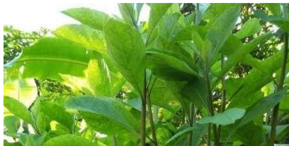
Gambar 1. Daun sambung nyawa

Sambung nyawa merupakan tumbuhan berbatang basah dan sepiantas menyerupai rumput berbatang tegak. Di Jawa, tanaman ini banyak terdapat di pedesaan yang tumbuh sebagai semak. Batang pohonnya berdiameter antara 0,2- 0,7 cm. Kulit luar berwarna ungu dengan bintik hijau dan apabila tua berubah menjadi kecoklatan. Daun sambung nyawa berbentuk bulat telur, pada tepinya bergerigi dengan jarak agak jarang berbulu hampir tak kelihatan. Panjang helai daun tanpa tangkai berkisar antara 2-5 cm. Tumbuhan ini mudah berkembang baik pada tanah subur, agak terlindungi dan di tempat terbuka. (Thomas, A.N.S, 1989). Kadungan senyawa di dalam sambung nyawa diantaranya mengandung zat aktif flavonoid, alkaloid, saponin, tannin, dan zat antineoplastik. Sambung nyawa telah digunakan sebagai obat secara empirik dan telah banyak diteliti oleh para peneliti mengenai aktivitas dari senyawa untuk mencegah dan menyembuhkan penyakit. Beberapa penelitian diantaranya sambung nyawa sebagai antioksidan (Afandi, 2014), penggunaan untuk mengetahui adanya hiperkolesterolemia pada hati (Ismail, 2015), serta efektivitas sebagai antihipertensi (Firmansyah, 2015).