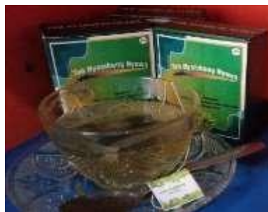
Gambar 5. Produk teh jadi

Hasil dari pembuatan produk teh ini berupa teh kantung pada umumnya. Produk dibuat dalam sediaan teh kantung untuk mempermudah masyarakat dalam mengkonsumsinya tanpa perlu merebus atau menyaring. Gambar 5 adalah contoh hasil produksi teh daun sambung nyawa kombinasi daun putri malu.