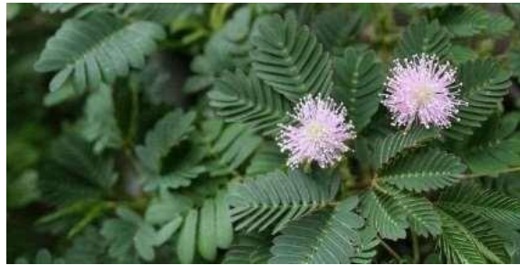
Gambar 2. Putri Malu

Potensi kesehatan daun sambung nyawa dan daun putri malu belum banyak diangkat sebagai sebuah produk, menjadi suatu ide produk yang bermanfaat di tengah wabah Covid-19 seperti saat ini. Produk inovasi yang dapat dikembangkan untuk mempermudah konsumsinya, salah satunya dalam bentuk sediaan teh. Produk ini tersedia dalam bentuk teh karena dalam produksinya terbilang mudah dan sederhana. Sediaan teh sudah dikenal lama oleh masyarakat Indonesia, sehingga produk ini akan lebih mudah diterima dan digunakan oleh masyarakat. Kelebihan sediaan teh salah satunya adalah peracikannya cukup mudah jikadikonsumsi sebagai minuman.