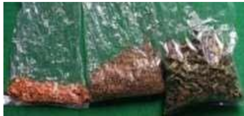
Gambar 3. Simplisia

Dalam pemilihan bahan baku simplisia daun yang baik, harus memenuhi persyaratan diantaranya simplisia harus dalam keadaan kering, disimpan di dalam tempat yang sejuk, terhindar dari cahaya sinar yang dapat mempengaruhi mutu, dan terhindar dari pengotor yang dapat memengaruhi mutu simplisia. Simplisia lembab ataupun rusak secara fisik tidak dapat dijadikan bahan baku pembuatan produk. Kualitas simplisia dapat mengalami kerusakan maupun penurunan mutu yang disebabkan beberapa faktor diantaranya, cahaya sinar dengan panjang gelombang tertentu dapat mempengaruhi mutu simplisia secara fisik maupun kimiawi seperti terjadinya isomerasi dan polimerasi, oksidasi pada proses penyimpanan simplisia, dimana oksigen dari udara menyebabkan terjadinya oksidasi pada senyawa aktif, kontaminasi zat asing yang mempengaruhi mutu simplisia serta adanya serangga maupun kapang yang dapat membahayakan konsumen karena adanya senyawa aktif yang terurai (Indah, 2016). Dengan melihat hal tersebut, pemilihan simplisia harus tersortir dengan baik dan benar agar mutu produk yang dihasilkan dapat lebih baik. Tampilan simplisia secara umum dapat dilihat pada Gambar 3. Penyimpanan simplisia jika tidak habis digunakan, sebaiknya dalam wadah tertutup dan kedap udara.