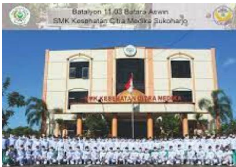
Gambar 3. Foto SMK Citra Medika Sukoharjo

Program studi Bahasa Inggris Universitas Duta Bangsa sudah bekerja sama dengan SMK Kesehatan tersebut dalam berbagai kegiatan untuk peningkatan kompetensi siswa siswi salah satunya adalah dalam pelaksanaan test English Proficiency Test untuk calon alumni. Calon alumni SMK Kesehatan Citra Medika Sukoharjo selalu mengikuti English Proficiency Test yang berbasis pada TOEIC setiap tahun untuk membekali calon alumni dengan sertifikat kompetensi Bahasa Inggris. Setyowati at al (2020) menjelaskan berdasarkan hasil test English Proficiency Test tahun akademik 2019/2020 yang dilakukan disekolah tersebut tanpa ada pembekalan atau preparation diperoleh hasil sebagai berikut dari 158 siswa yang mengikuti tes ada 37 siswa yang memiliki kemampuan komunikasi “No Useful Proficiency”, ada 48 siswa yang memiliki kemampuan komunikasi “Memorized Proficiency”, ada 43 siswa yang memiliki kemampuan “Elementary Proficiency” dan ada 30 siswa yang memiliki kemampuan “Elementary Proficiency Plus”.