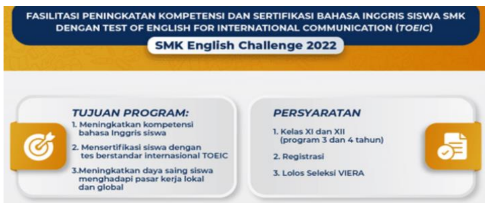
Gambar 1. Pengumuman Pembukaan SMK English Challenge 2022

Kompetensi Bahasa Inggris untuk lulusan SMK sebagai kompetensi yang sangat penting dilihat dari adanya Program VIERA ( Vocational Integrated English Readiness Assessment ). VIERA ini diselenggarakan oleh Direktorat SMK untuk memfasilitasi peningkatan kompetensi dan sertifikasi bahasa Inggris untuk peserta didik SMK dengan Test of English for International Communication (TOEIC). Program VIERA ini merupakan program untuk menyiapkan peserta sebelum mengikuti TOEIC yang sesungguhnya yang bersifat kompetisi. Nantinya peserta yang skornya sesuai dengan kualifikasi akan lanjut mengikuti tes TOEIC dan berhak mendapatkan sertifikat TOEIC. Sertifikat ini nantinya sangat berguna untuk masa depan peserta didik. Tujuan program VIERA menurut Direktorat SMK, yaitu (1) Meningkatkan kompetensi bahasa Inggris peserta didik, (2) Memberikan sertifikasi berstandar internasional kepada peserta didik, dan (3) meningkatkan daya saing peserta didik dalam menghadapi pasar kerja global. Program VIERA diselenggarakan setiap tahun.