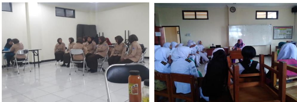
Gambar 5. Proses Pembekalan EPT