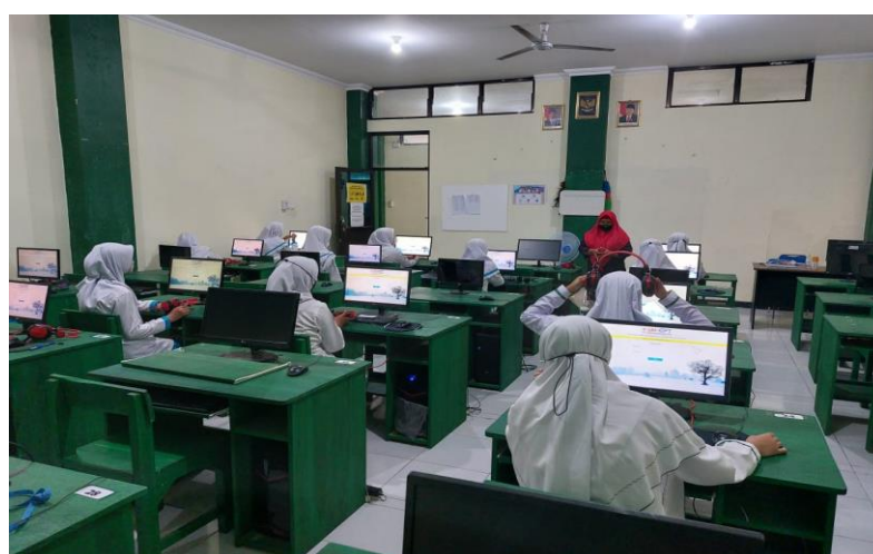
Gambar 6. Kegiatan Pelatihan Pengenalan Program dan Pemahaman Direction dari CBT EPT

Di akhir kegiatan pembekalan EPT siswa siswi mengikuti test CBT English Proficiency Test dan berikut ini hasil EPT calon alumni SMK Kesehatan Citra Medika Sukoharjo. Ada 145 calon alumni yang mengikuti program ini dan berdasarkan hasil CBT English Proficiency Test ini diperoleh hasil nilai terbaik 565, nilai terendah 100 dengan nilai rata rata 228. Berdasarkan hasil tertinggi menunjukan jika ada beberapa siswa yang sudah menguasai komunikasi Bahasa Inggris di level intermediate akan tetapi masih ada yang belum menguasai kemampuan komunikasi sama sekali terbukti dengan perolehan nilai EPT 100. Hasil test EPT tersebut dapat menjadi tolak ukur kemampuan komunikasi Bahasa Inggris siswa SMK Citra Medika Sukoharjo akan tetapi berdasarkan proses pembekalan ada lebih dari 10% siswa yang mampu berkomunikasi dengan baik tetapi memperoleh score EPT anatar 250 sd 350.